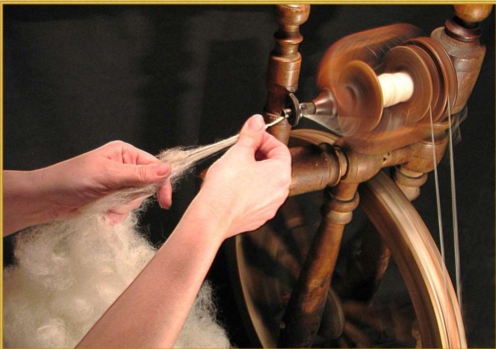
Мастерство прядения на колесной прялке.