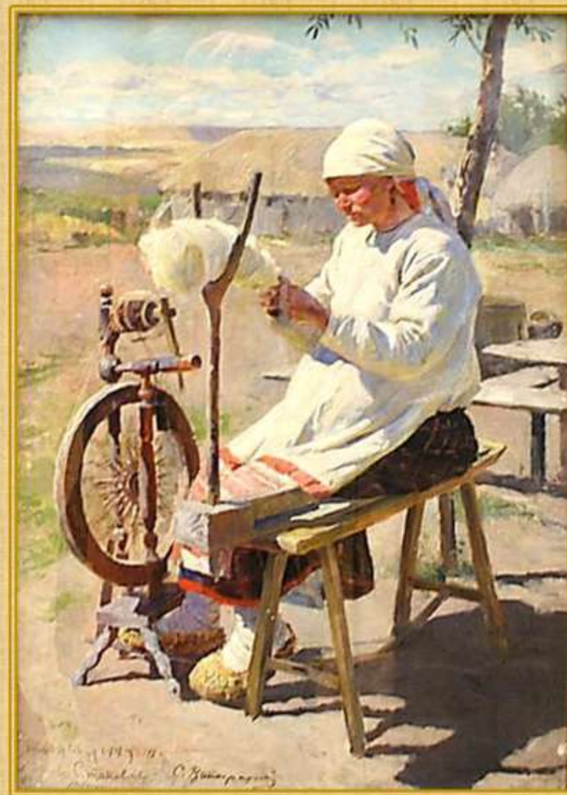
Сергей Виноградов. Пряха. 1895г.