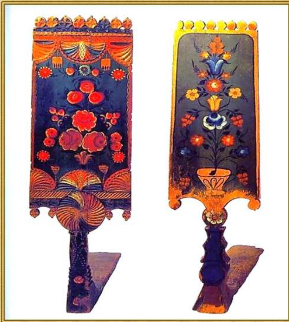
ПРЯЛКА-ДОНЦЕ (пряслице, ручная прялка)