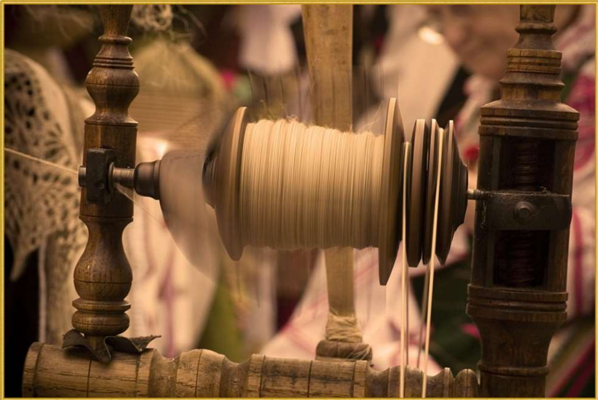
Катушка с пряжей.