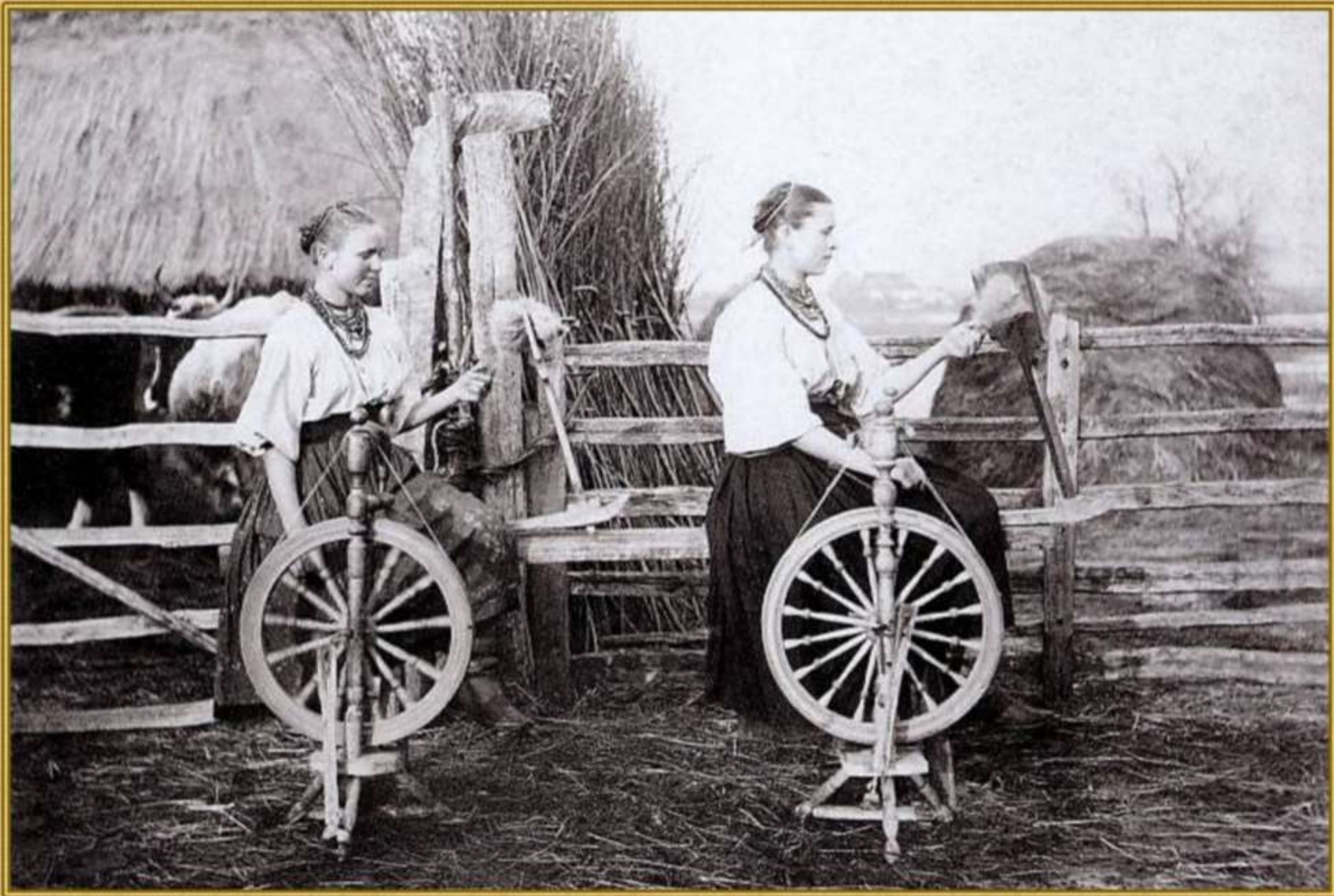
Молодые пряхи. 1906 г.