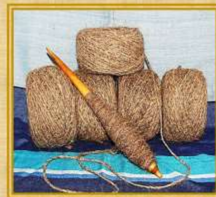
Веретено и готовая пряжа