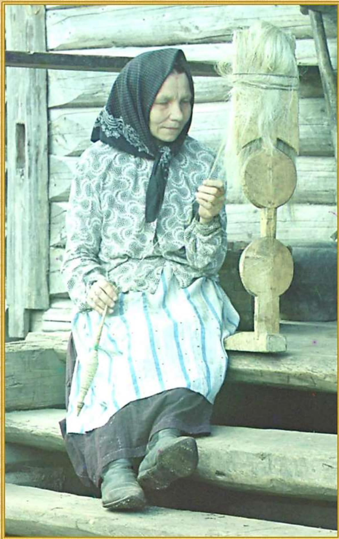
Прядение на пряслице.